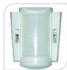
MX GUARD € 230,00

RM-1 è un telecomando per taratura che funziona con i rilevatori OUT-SMART e altri rilevatori Maximum Security. Il rilevatore funziona solo in base ai parametri che sono stati impostati/programmati dal telecomando per taratura.