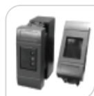
ULTIMATE INSERT € 61,00

Possibilità di programmazione totale della centrale. Tasti a sfioramento retroilluminati sensore Tag integrato, 2 ingressi + 2 uscite liberamente configurabili.