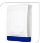
SE- MD-325R € 131,60

Telecomando senza fili, indicatore luce a LED, Tensione di lavoro 3V, * CR2032 batteria al litio, Distanza di comunicazione wireless: 100M – frequenza 433Hz Dimensione del prodotto: 62*32.5*13mm. Peso netto 31.4g,