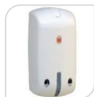
MX CURTAIN € 164,00

Rilevatore a doppia tecnologia. Portata m 10 tenda a fascio stretto 3°. Fornito con squadretta di fissaggio a 90 °°, installazione facilitata (2 fili). PRESTAZIONI : Schermo protettivo a fascio stretto 3 Sensibilità regolabile per ciascuna tecnologia Funzionamento a coincidenza o a tecnologia singola Antimascheramento con fasci attivi infrarossi Compensazione automatica della temperatura e del rumore di fondo Analizzatore A/D del segnale Ingresso memoria allarme Elevata immunità alle interferenze RFI e EMI Squadretta di fissaggio a 90 fornita a corredo. Alimentazione da 9 a 14 Vc.c. portata di rilevazione m 10, angolo stretto 3 Assorbimento standby 20mA, in allarme 30mA max Risposta antimascheramento 90 secondi *PESO: g 80