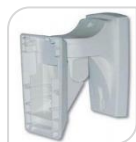
SNODO PER GUARD € 22,00

Staffa braccio supporto a snodo per sensore GUARD