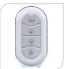
SE- PB-433R € 19,20

Telecomando senza fili, indicatore luce a LED, Tensione di lavoro 3V, * CR2032 batteria al litio, Distanza di comunicazione wireless: 100M – frequenza 433Hz Dimensione del prodotto: 62*32.5*13mm. Peso netto 31.4g,