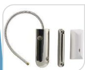
SE- MD-212R € 60,00

contatto di tapparelle senza fili, Invia report di stato all'host ogni 40 minuti, * Batterie AAA, Funzioni anti-manomissione, allarme display a LED, Lunghezza filo fino a 250cm