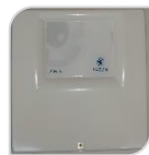
ULTIMATE ALBA 16 € 520,00

Centrale con 8 ingressi indipendenti espandibili a 16 tramite concentratori 4 uscite open collector in centrale GMS integrato, Modulo vocale integrato, Uscita sirena esterna, Uscita sirena interna, Scambio libero in centrale, Ingresso tamper sirena, Ingresso Tamper centrale.