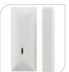
SE- MD-210R € 30,00

Dimensione del prodotto: Ø108*42.5(H)mm. Peso netto 159g