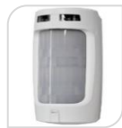
MX VIP-PRO € 187,00

Rilevatore a doppia tecnologia. Portata m 10 tenda a fascio stretto 3°. Fornito con squadretta di fissaggio a 90 °°, installazione facilitata (2 fili). PRESTAZIONI : Schermo protettivo a fascio stretto 3 Sensibilità regolabile per ciascuna tecnologia Funzionamento a coincidenza o a tecnologia singola Antimascheramento con fasci attivi infrarossi Compensazione automatica della temperatura e del rumore di fondo Analizzatore A/D del segnale Ingresso memoria allarme Elevata immunità alle interferenze RFI e EMI Squadretta di fissaggio a 90 fornita a corredo. Alimentazione da 9 a 14 Vc.c. portata di rilevazione m 10, angolo stretto 3 Assorbimento standby 20mA, in allarme 30mA max Risposta antimascheramento 90 secondi *PESO: g 80