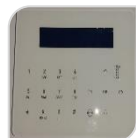
ULTIMATE MITIA € 240,00