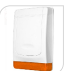
SE- MD-325 € 76,00

Sirena esterna via radio 433Hz (a batteria), Corrente di standby: 0.7mA, Distanza di ricezione: 80m, Volume:100db@ 1M, Corrente di allarme: 500mA, Tensione: 6V, 4pcs*LAR20 batterie Dimensione del prodotto: 192(L)*60(W)*301(H)mm. Peso netto 1026g,