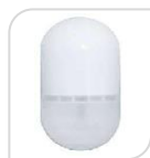
SE- MC-565R € 52,00

Sensore di movimento a infrarossi intelligente PIR, Tensione di lavoro 3V, batteria al litio 1*CR123A, Immunità animale meno di 10kg, segnale batteria scarica, 120m distanza di emissione wireless (distanza aperta), Distanza di rilevamento: 12m@25, C, angolo di rilevamento: 110.