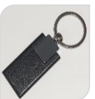
ULTIMATE KEY € 12,60

Chiave trasponder per tastiera e attivatori