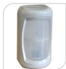
MX 3D ANTI-MASK € 109,00

Rilevatore a doppia tecnologia PIR+MW con antimascheramento e antivibrazione. Portata 12m, ampio angolo. Due sensori passivi d'infrarossi + 1 sensore a microonda. Antimascheramento frontale ad infrarossi attivi. Funzionamento a microprocessore, regolazione sensibilità PIR, MW e funzionamento AND-OR su antimascheramento. Contatto antiapertura. Funzione di memoria allarme mediante LED su rivelatore. Compensazione automatica in temperatura. Regolazione con telecomando RM-1 (non incluso).Regolazione verticale della portata Commutazione da “AND” in “OR”. Selezionabile tramite dip-switch. Antirimozione mediante sensore inerziale incorporato. IP 65. Alimentazione 12V