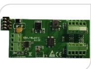
ULTIMATE SHUTTLE € 70,00

Chiave trasponder per tastiera e attivatori