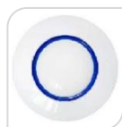
SE- MC-7380R € 48,00

Dimensioni del prodotto: 65(L)*37(W)*120(H)mm. Peso netto: 148.4g,