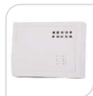
SE- Z-08 € 100,00

Centrale 8 zone espandibile fino a 96 zone filari e 32 zone via radio . Allarme intelligente compatibile con sistema Wireless e via cavo, gestibile tramite app, 8 partizioni dei sensori, 4 autorizzazioni di password utente, 3 combinatori GSM+LAN+GPRS, timer impostabile da remoto, zone espandibili fino a 128 tramite modulo di espansione SE- Z-08. WEB server + modulo Lan integrato + modulo 4G. Gestibile da app Il kit comprende centrale + tastiera.