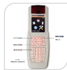
MX RM-1 € 196,00