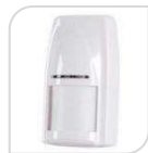
SE- DT-81R € 96,00

Dimensione del prodotto:108(L)*58(W)*40.5(H)mm Peso netto 73.1g.