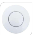
SE- MD-2105R € 60,00

Dimensione del prodotto: Ø111*40(H)mm. Peso netto179.6g