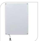
SE- DM-449R € 61,60

Dimensione del prodotto: 81*32*25mm; Banda magnetica: 74.5*13.5*18.8mm Peso netto 61.5g,